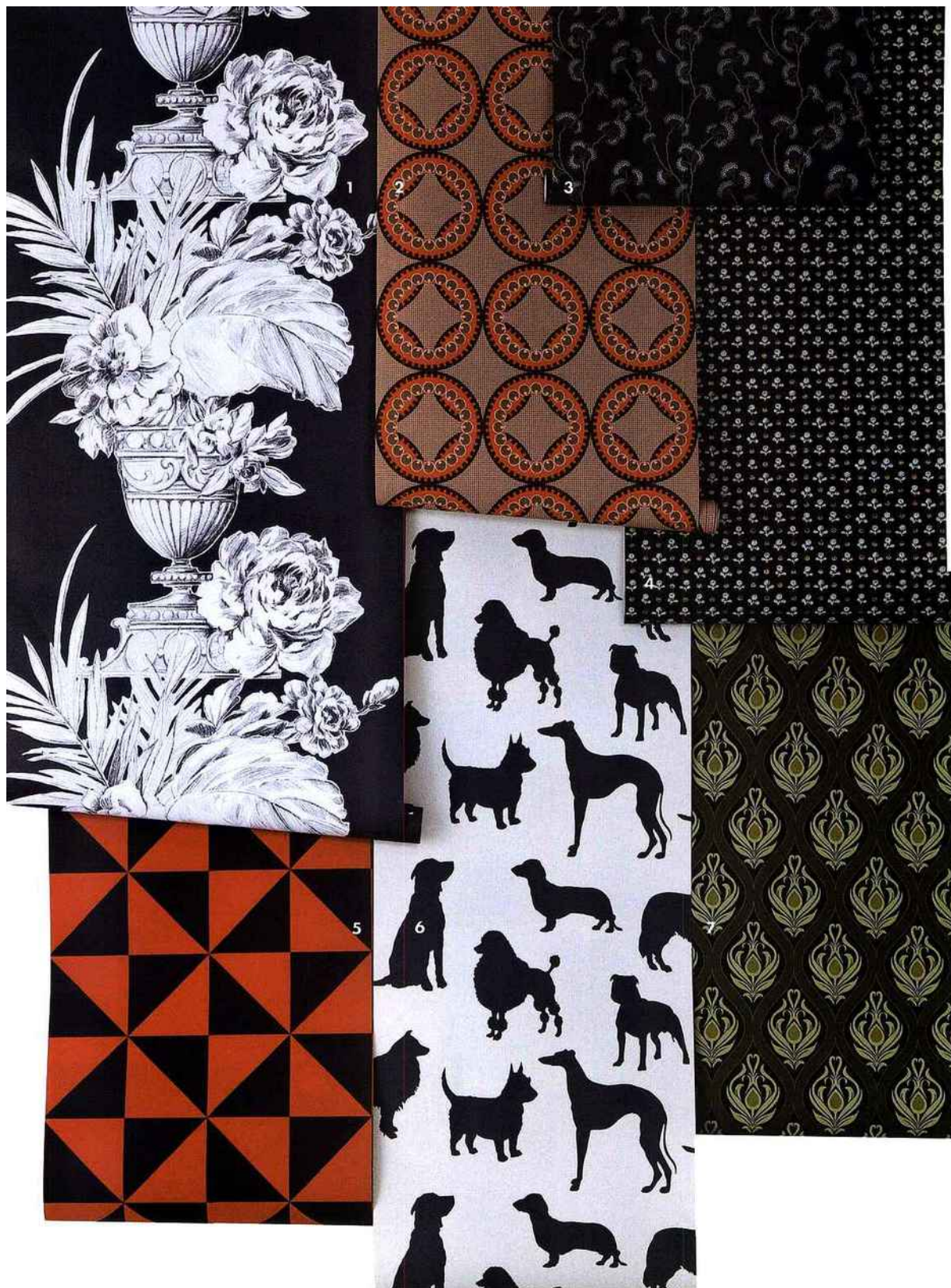
LE CHIC DE LA CITY. 1. Crayonné. "Palmer Charcoal", 87,40 € le rouleau de 10 m en 68,5 cm de large (Designers Guild) 2. Hypnotique. "Moonsh Circles", 108 € le rouleau de 10 m en 52 cm de large (Neisha Crosland chez Au Fil des Couleurs) 3. Bucolique. "Ashbury", coll "Ashbury", 77 € le rouleau de 10 m en 52 cm de large (Colefax & Fowler) 4. Semis. "Folco", collection "Paradiso", 68 € le rouleau de 10 m en 52 cm de large (Nina Campbell chez Osborne & Little) 5. Géométrique. "Anarchist Knight", design Henrik Plenge Jakobsen, 130 € le rouleau de 10,50 m en 53 cm de large (Le Papier Peint) 6. Avec du chien. "Best in show", 70 € le rouleau de 10 m en 52 cm de large (Osborne & Little) 7. Art Nouveau. "Bruges", 19,90 € le rouleau de 10 m en 53 cm de large (Heylens) Adresses p. 161